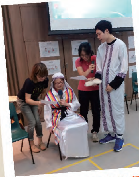
靈性服務：宣基堂崇拜

靈性服務亦都是單位重點的工作。除了以往心靈關懷協會定期的福音團契之外，在2019年我們亦接受了宣基堂的主日崇拜，透過詩歌、分享及聖經的故事，讓服務使用者在信仰及心靈得到一定的照顧。