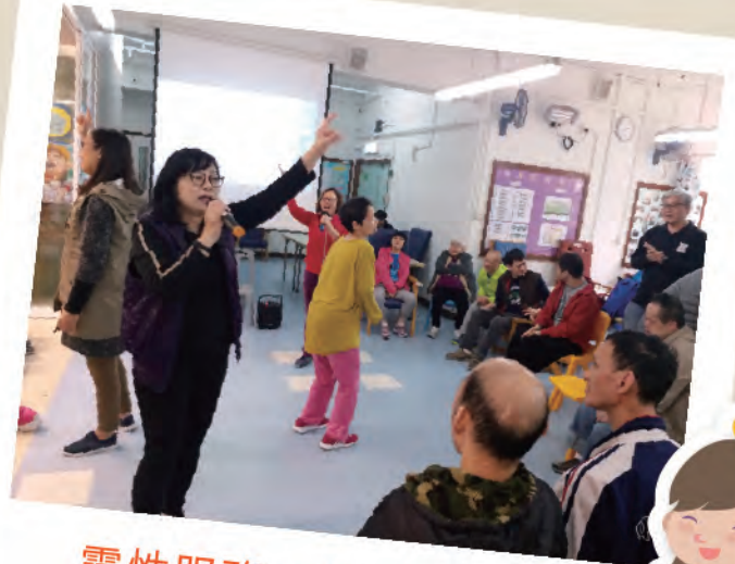
靈性服務：心靈關懷協會